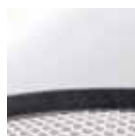
ALUMINIUM LAQUÉ GLOSSY ALUMINIUM ALUMINIO LAQUEADO